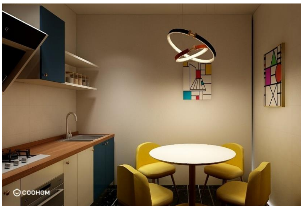
Рис. 3. Обеденная зона.

Откликом творчества Мондриани являются разные декоративные предметы в интерьере. На взаимно перпендикулярные стены в обеденной зоне мы повесили панно, выполненные в технике холодного батика по живописи Мондриани. Подвесной светильник над обеденным столом также несет в себе дух Мондриани (рис. 3).