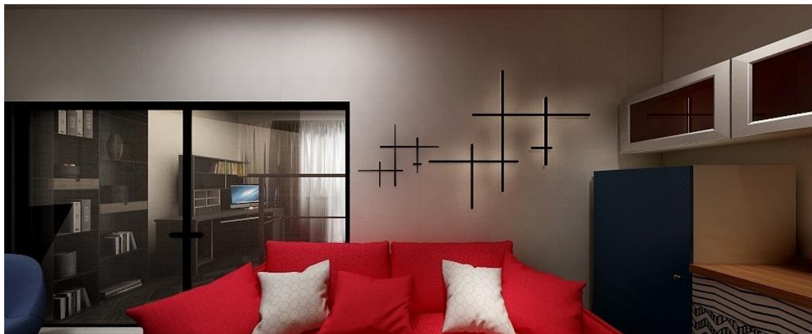
Рис. 4. Светильники, ассоциирующие с матрицей Мондриани.

Над диваном мы разместили современные светильники в виде абстрактных матриц, состоящих из чёрных горизонтальных и вертикальных линий концепции Мондриани (рис. 4).