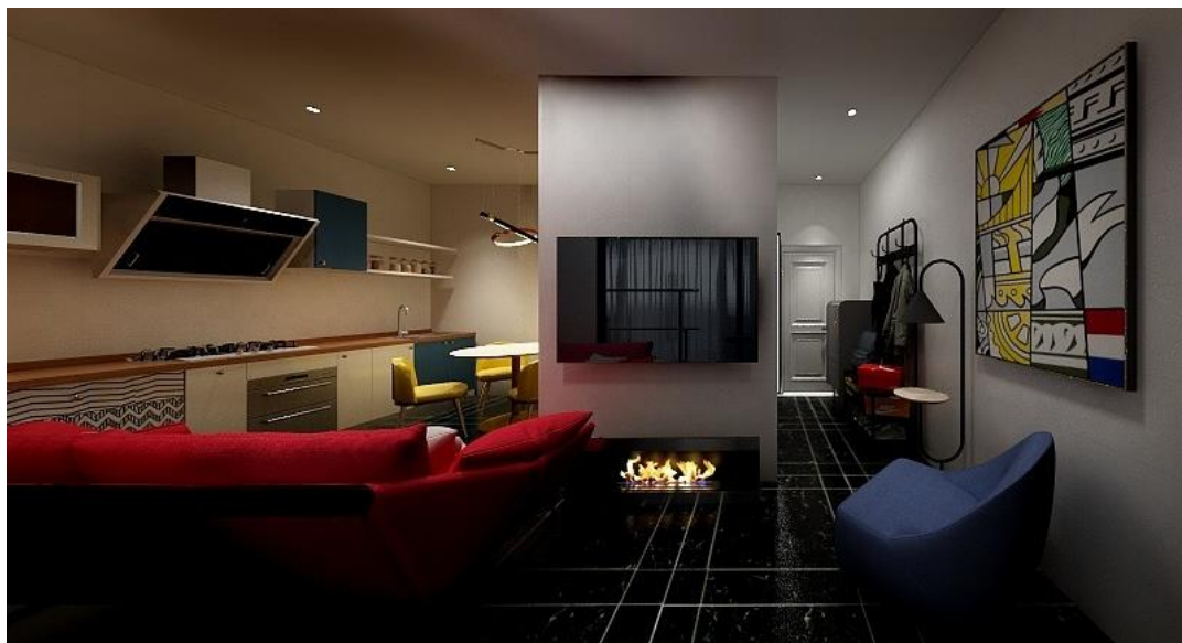
Рис. 1. Вид интерьера общей комнаты.

Поскольку мы создавали интерьер для молодого человека, который сегодня творит своё будущее – личную жизнь, карьеру, эмоциональную и материальную среду обитания, мы посчитали, что будет уместно и правильно использовать в интерьере концепцию Мондриани. Мы выбрали современный минималистичный стиль с элементами модернизма, которые можно найти в формах мебели и элементах декора. В качестве основных цветов интерьера выбрали белые стены, чёрный пол и три основных цвета в виде пятен. Белый и чёрный создают фон, канву, в которой в виде пятен распределены красный диван, желтый стол и стулья, синее кресло и фасады холодильника и кухонных шкафов. Синий фасад холодильника размещен симметрично креслу, и вместе с кухонными шкафами они уравнивают солнечно-желтый цвет обеденного стола и стульев (рис.1).