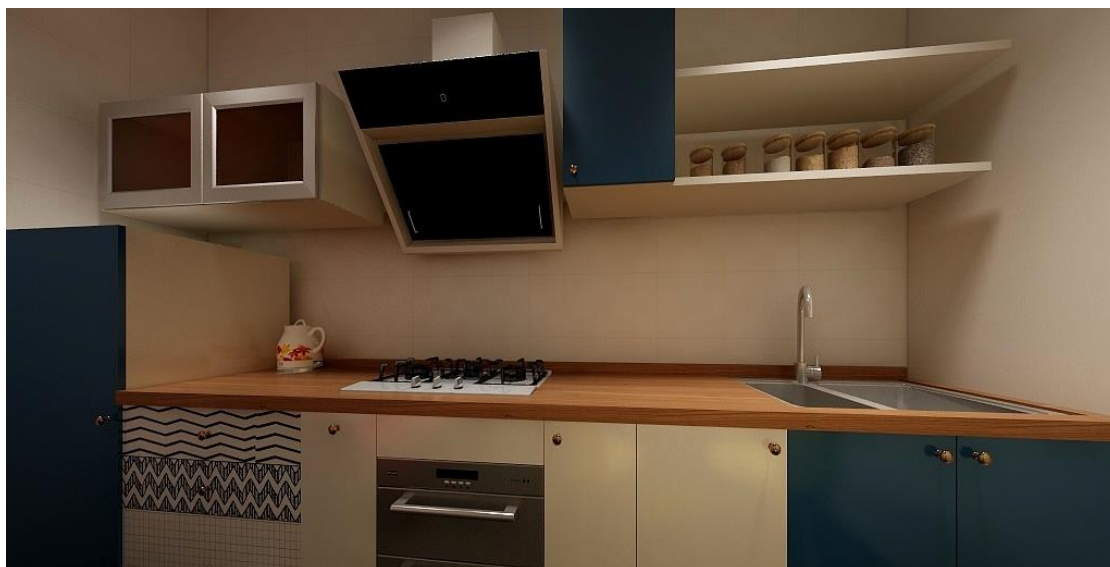
Рис. 2. Вид кухонной стенки.

Строгую категоричность цветов интерьера, смягчили нейтральным светло-коричневым цветом дерева рабочей поверхности кухонного гарнитура и ручек комода, размещенного в коридоре. Деревянная поверхность привносит тепло в интерьере и компенсирует холодность гранитной плитки на полу и белизны стен и потолка. В интерьер также внесли ахроматический серый цвет в виде комода в коридоре и кухонной техники (рис. 2).