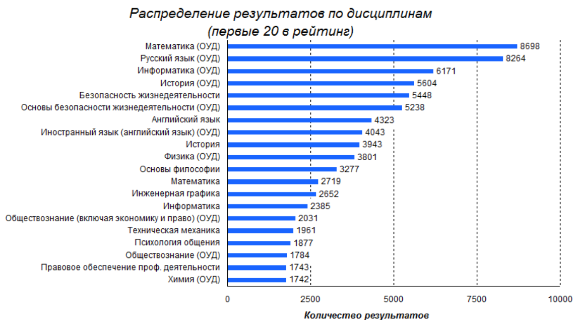
Рис. 1. Распределение результатов по дисциплинам.

В общей характеристике Примерной рабочей программы по дисциплине «История» отмечается, что «общеобразовательная дисциплина «История» является частью обязательной предметной области «Общественные науки», изучается в общеобразовательном цикле учебного плана ООП СПО с учетом профессиональной направленности в соответствии с ФГОС СПО на базовом и углубленном уровнях» [1].