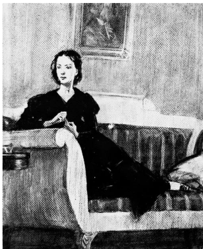
Рис. 2. Д. Шма́ринов. Наташа Ростова. Иллюстрации к роману Л. Толстого «Война и мир»

Известен в основном как иллюстратор. Автор журнальных и газетных рисунков (с 1923), художник книги в издательствах «Гослитиздат», «Детгиз», «Молодая гвардия» и др. (с 1927), «Искусство» (1941-45). Его работам присущи реалистическая точность изобразительной интерпретации литературных произведений, убедительность передачи драматических ситуаций и социально-психологических характеристик его героев.