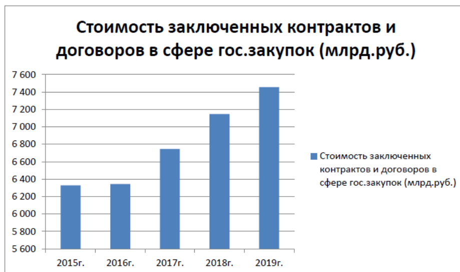
Рис. 1. Стоимость заключенных контрактов и договоров в сфере государственных закупок в 2016 г. – 6344 млрд руб. – 23,6% расходов консолидированного бюджета РФ; в 2017 г. – 6 745 млрд руб. и 24%; в 2018 г. – 7148 млрд руб. и 24,7%; в 2019 г. – 7456 млрд руб. и 25%

Современная контрактная система, за относительно небольшой период, преодолела несколько этапов – начиная с идеи о конкурсном размещении государственных заказов в 1990-х гг., до вступления в силу Федерального закона № 44-ФЗ, который регламентирует общие требования и правила к экономическим правоотношениям.