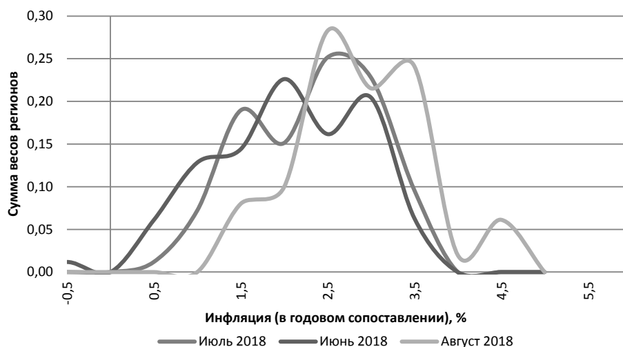
Рис. 3. Распределение регионов по вкладу в годовую инфляцию

Годовая базовая инфляция, а также медиана распределения годовых приростов цен повысились до 2,8% в сентябре. Повышения годовой инфляции наблюдается в большинстве регионов России, темпы прироста цен по федеральным округам находятся в интервале 2,6 – 3,9%. Региональная неоднородность темпов роста цен с июня 2018 г. продолжает снижаться (рис. 3), число регионов с относительно низкой инфляцией уменьшается.