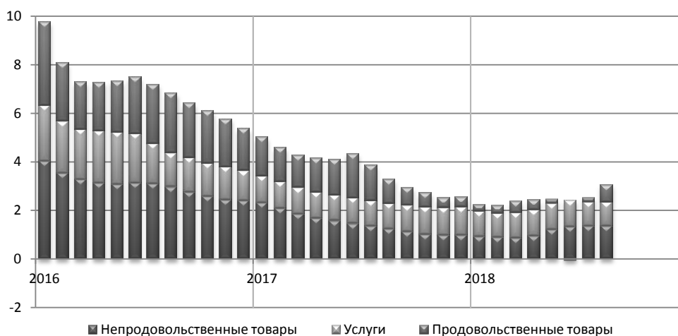
Рис. 2. Вклад в годовую инфляцию к соответствующему периоду предыдущего года

Годовая инфляция на непродовольственном рынке и в сфере услуг также несколько возросла (рис.2).