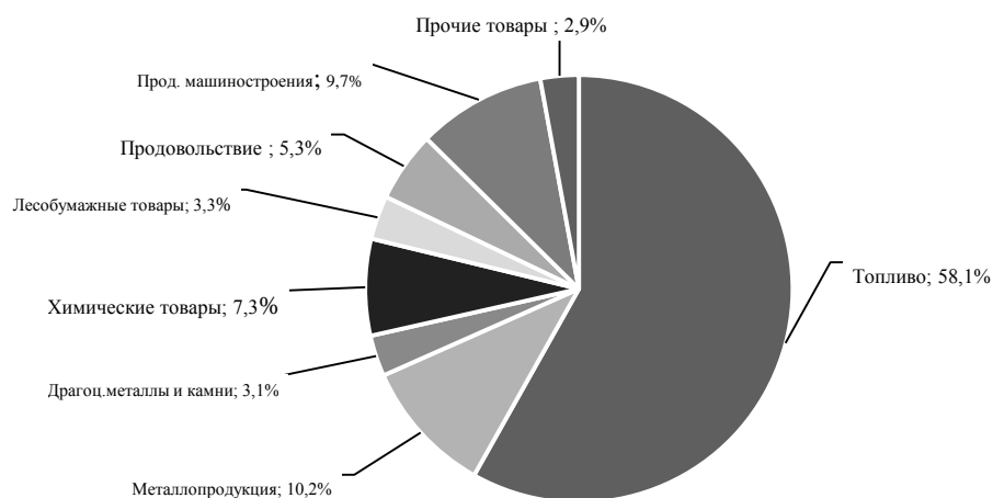
Рис. 2. Товарная структура экспорта России в 2016 году [2]

С точки зрения экспортного потенциала, на рынках металла Россия имеет сильные позиции, дальнейшее формирование и развитие потенциала требует последовательной модернизации производств и совершенствование государственного регулирования экспортной политики. Товары химической промышленности показали в 2016 году падение на 18,2%, которое может быть вызвано слабым развитием скоординированной рыночной стратегии и невниманием управленческих кадров данной отрасли к осуществлению маркетинговых коммуникаций. Экспортный потенциал машиностроительной отрасли имеет скрытый характер. Материальный и моральный износ техники и технологий, низкое качество продукции, влияющее на международную конкурентоспособность, низкая инвестиционная активность в данной отрасли не позволяют сформировать и использовать потенциал для экспортной экспансии на внешние рынки.