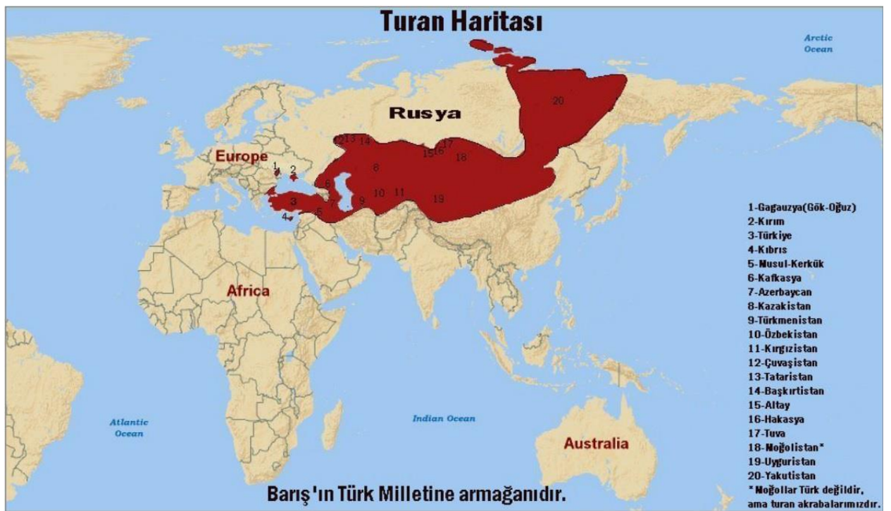
Рис. 1. Карта Великого Турана с обозначением входящих в него территорий / Map of Great Turan with the designation of the territories included in it Источник: Turan Haritasi: [[Электронный ресурс]. Режим доступа: https://twitter.com/rizakaya_1919 (дата обращения: 20.11.2023).