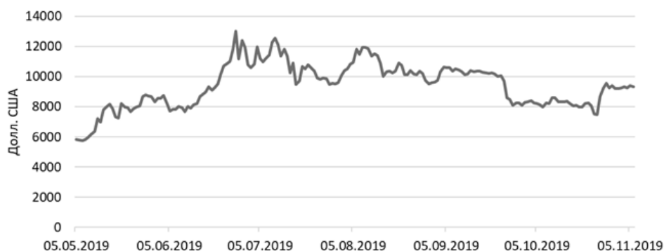
Рис. 2. Курс биткоина к доллару [4]

В текущем году наблюдалась попытка повторения ралли 2017 года, однако его продолжительность оказалась вдвое ниже (с января до конца июня) и курс биткоина достиг только уровня в 13 900 долларов. В настоящий момент для основных криптовалют характерна коррекционная снижающаяся тенденция (рис. 2).