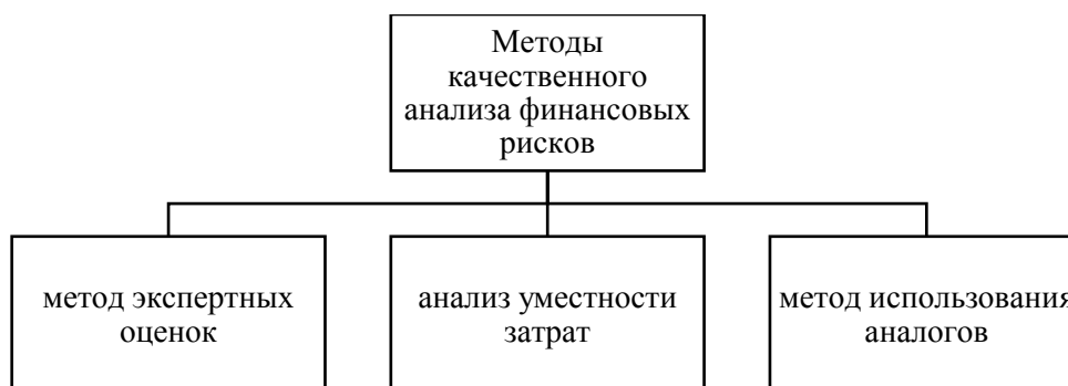
Рис. 1. Качественные методы оценки финансовых рисков организации

Все методы оценки рисков разделяются на количественные и качественные. Качественные методы оценки финансовых рисков рассмотрим на рисунке ниже.