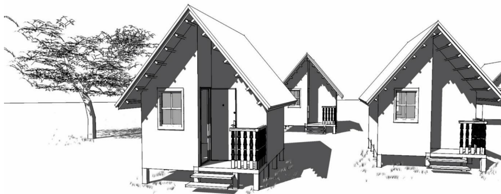
Рис. 1. Вид типового туристического дома, эксплуатируемого в летнее время

При размещении туристов и отдыхающих используются ячейки следующего типа: