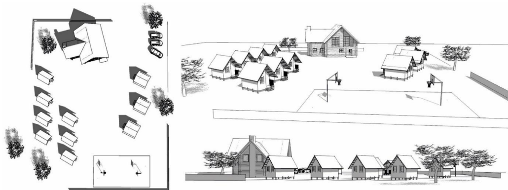
Рис. 2. База отдыха, включающая в комплекс зданий и сооружений несколько домов, эксплуатируемых сезонно, главный корпус, спортплощадку и место для парковки машин

На рисунке 2 представлена типовая планировочная организация базы отдыха с периметральным (контурным) расположением зданий и сооружений, а также основные элементы планировочной структуры.