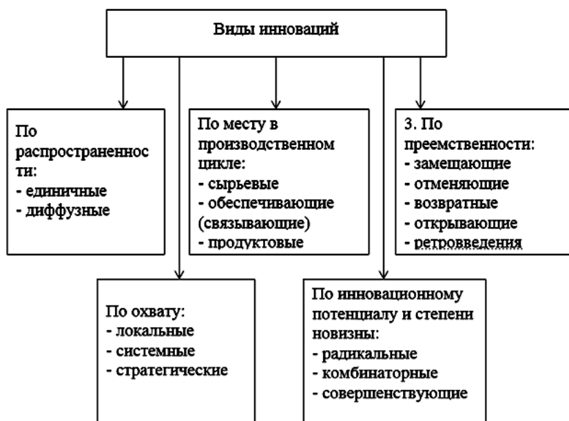
Рис. 1. Виды инноваций