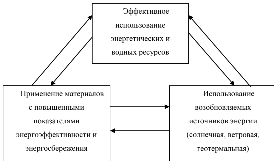
Рис. 1. Механизм повышения энергоэффективности

Необходимость долгосрочного и масштабного финансирования с одновременным учетом территориальной специфики приводит к тому, что развивать и моделировать инновационно-технологически энергоэффективные технологии целесообразно и эффективно именно на региональном уровне.